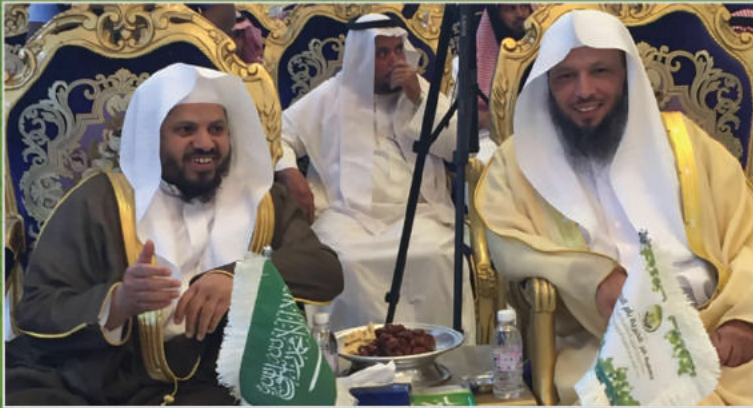
« الراعي الذهبي مربي المخلديات صحيفة عكاظ وسبق قناة المجد متحف علي جهز.