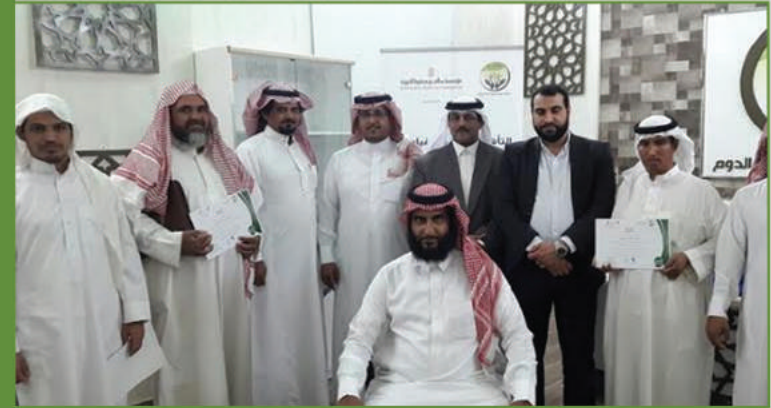
« يعتبر هذا البرنامج احد برامج الجمعية للتطوير قدرات العاملين بها.